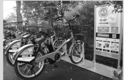
ドコモ・バイクシェア

品川区内では、赤い車体の「ドコモ・バイクシェア」や白い車体の「ハローサイクリング」などが利用できます。