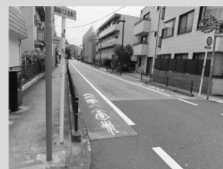
自転車ナビマーク

自転車の車道通行を促すため、車道の左端に路面標示（ピクトグラム）を行ったものです。