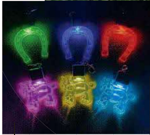
光るキーホルダー(蹄鉄型・馬型) 1個各800円

東京メギルミ(大井競馬場) 販売先: 東京都競馬 (勝島2-1-2 ☎3763-8702)