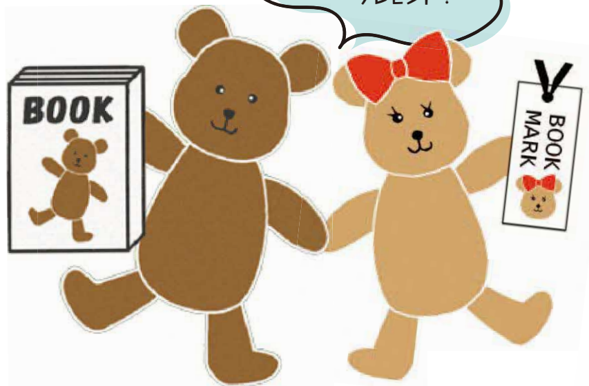
品川区子ども読書活動推進PRキャラクター「ブックマくん」&「しおりちゃん」

他にも各館で様々なイベントを開催します。詳しくは、品川区立図書館ホームページをご覧ください。