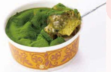
生カステラ(濃い抹茶・濃いほうじ茶) 1個各540円