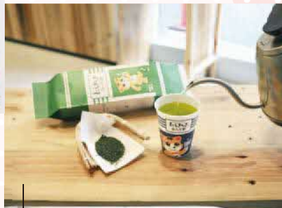
とごしぎんぎ ぶらり茶(緑茶・ほうじ茶) 1袋(5カップ入り)各650円