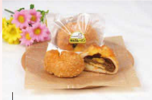
アंकルのママの焼きカレーパン 1個300円