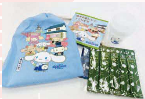
品川紋次郎 てづくり抹茶セット 1セット1,000円