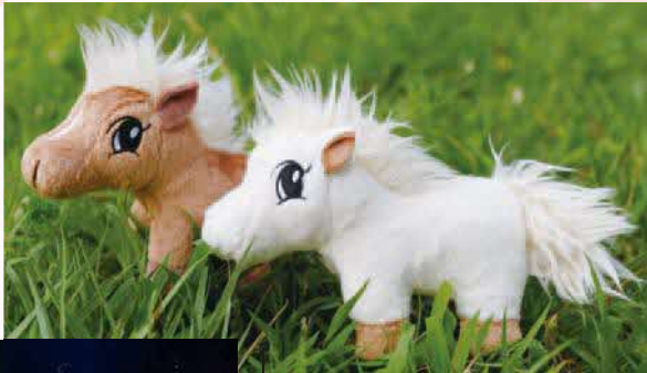
ミニチュアホースのぬいぐるみ(白・茶) 1頭各1,300円

問い合わせ しながわ観光協会 ☎5743-7642、文化観光課 (☎5742-6913 Fax5742-6893)