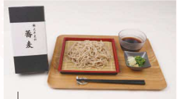
土産蕎麦 1箱(4人前)1,980円