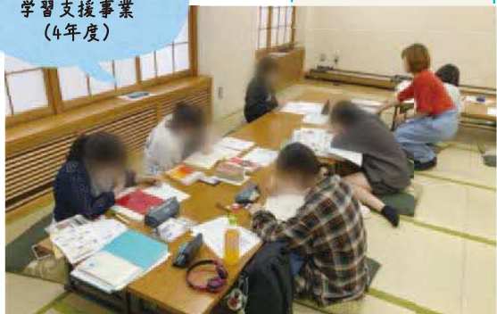
マナビファクトリー