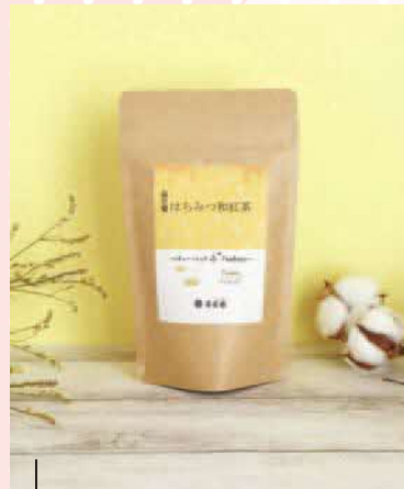
はちみつ和紅茶 1袋(ティーバッグ5袋入り)500円