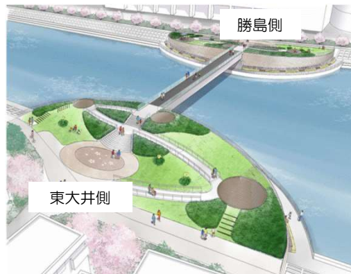
人道橋の整備イメージ