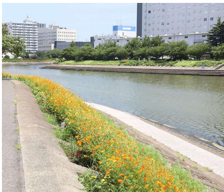
地域団体が管理している花壇

今回、兩岸を結ぶ人道橋の架設計画を踏まえ、本計画地を都市計画公園とすることで、今後も永く地域の賑わいの拠点とするとともに、歩いて楽しいまちとしていくため、都市計画変更を行う。