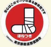
このマークの団体の接骨院が行います

外出が難しい方や不安な方に、区内接骨院の柔道整復師(機能訓練指導員)が自宅を訪問し、目標に向けた運動指導・外出訓練を短期集中で行います。