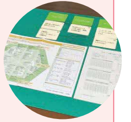
VRTカードを利用している様子

「VRTカード」とは、カードに書かれている仕事内容への興味や、その仕事を行うことについての自信を判断することで、興味の方向や自信の程度を明確にするためのものです。自己理解が深まることで、就業相談もスムーズになります。