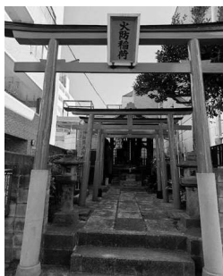
(小山四丁目・東 美佐栄)