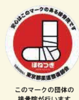
このマークの団体の接骨院が行います

高齢者地域支援課介護予防推進係(☎5742-6733 Fax5742-6882)