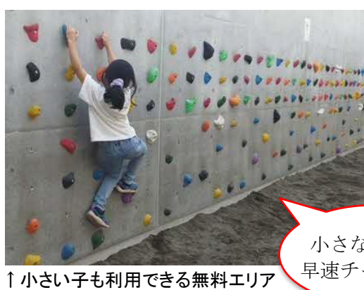
↑小さい子も利用できる無料エリア