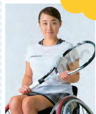
車いすテニス 二條実穂選手(2016リオデジャネイロパラリンピックダブルス4位入賞)