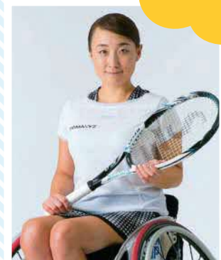
車いすテニス 二條実穂選手(2016リオデジャネイロパラリンピックダブルス4位入賞)