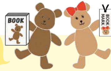
品川区子ども読書活動推進PRキャラクター「ブックマくん」[しおりちゃん]