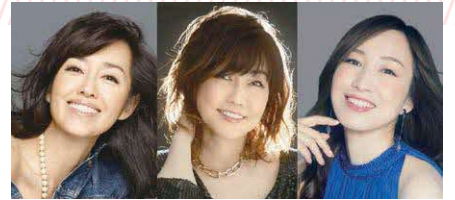
早見優 松本伊代 森口博子

日時 2月17日(土)午後4時30分から 会場 きゅりあん大ホール(大井町駅前) 料金 前売券2,500円、当日券3,000円 ※就学前のおさんは入場できません。 ※1人4枚まで購入できます。 ※前売券が完売した場合、当日券の販売はありません。 ※宝くじの助成による特別料金です。 発売開始日・時間 12月15日(金) 窓口 午前9時から=きゅりあん・スクエア荏原・メイプルセンター・O美術館 (O美術館は発売翌日以降の午前10時から) 電話 午前10時から=チケットセンターキュリア ※電話予約は座席選択不可。 インターネット 午前9時から=https://www.shinagawa-culture.or.jp