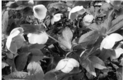
令和5年3月 林試の森にて撮影

うつむいたように可憐な花を咲かせるクリスマスローズは12月から早春にかけて開花します。美しい白い花を咲かせる原種ニゲル(有茎種)から始まる交配の歴史は古く、ドイツやイギリスを中心に開始され、20世紀後半に品種改良が盛んに進められました。