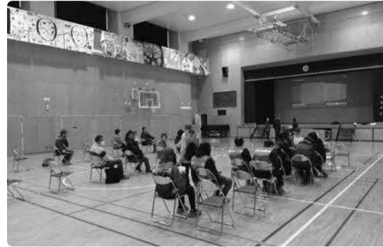
第三日野小学校にてマンションの防災対策についてのビデオを視聴する様子

令和5年12月2日に区内一斉防災訓練を実施しました。各学校に避難所を開設する訓練を通して、区民の防災に対する意識や災害時の行動力を高めることができました。（事務局）