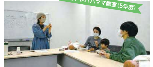
多胎プレババママ教室(5年度)

問い合わせ 地域活動課協働推進係 (第二庁舎6階 ☎5742-6693 Fax5742-6878)