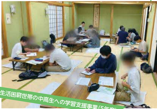
生活困窮世帯の中学生への学習支援事業(5年度)