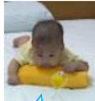
ボクも利用したよ!!