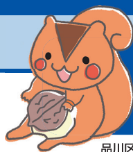
品川区くるみちゃん