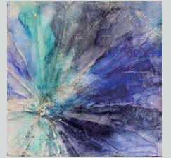
Yaco「by the sea」 2025 Mixed media

品川ゆかりアーティストのYaco、Mari Suzukiを含む6人のアーティストたちの五感に訴える作品を通じて、様々な“つながり”を感じられる展示会です。