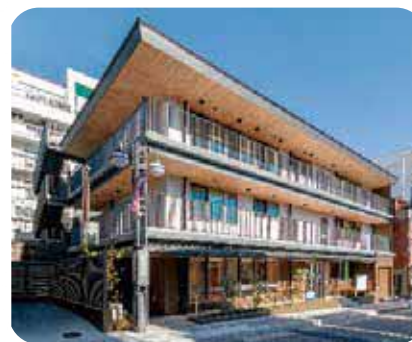
高齢者多世代交流支援施設 (北品川ゆうゆうプラザ)