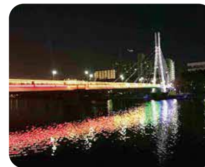
ライフ・イン・ハーモニー推進月間 (かもめ橋ライトアップ)