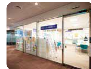
ジェンダー平等推進センター