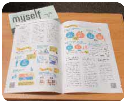
ジェンダー平等啓発誌 マイセルフ