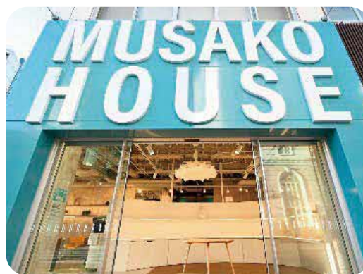
武蔵小山創業支援センター