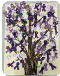
パープルリボンの木