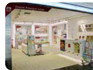
しながわ防災体験館