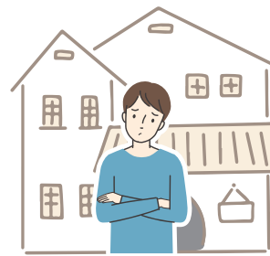
空き家を 借りりたい方