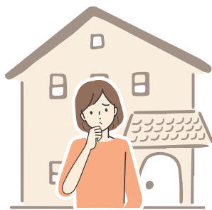
空き家を 持っている方