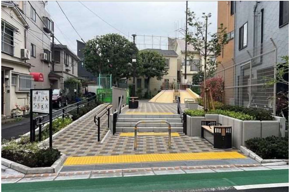
豊町5丁目児童遊園