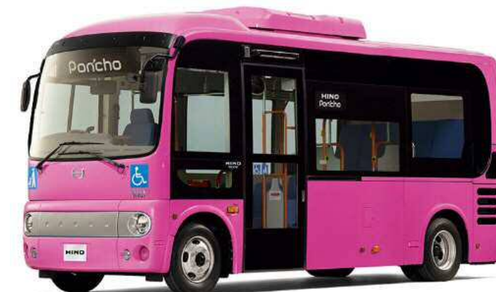
日野自動車 ポンチョ ショート ※ボディカラーはイメージ