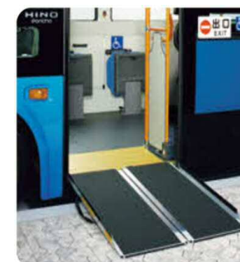
スロープ版(着脱式)