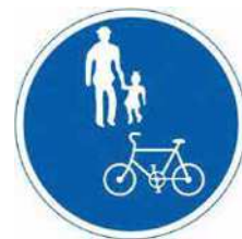
自転車および歩行者専用標識