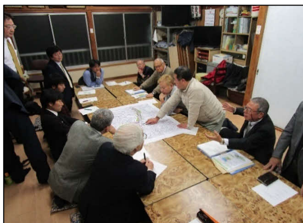
▲戸越公園駅周辺のまちづくりの現況を共有

まちにお住まいの皆様からのご意見も取り入れ、検討を進めていきたいと考えております。是非ご意見をお聞かせ下さい。