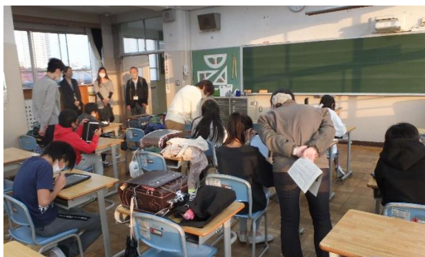
伊藤小学校での6年生の未来塾の様子

品川地域未来塾とは、授業時間外に、地域の方々をはじめとする指導員のもと、多くの学校で行われている学校支援本部事業による学習支援の一つです。