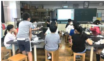
仙台市の講師に質問

立会小学校では、5年生理科「再生可能エネルギー」の授業を東北大学の先生と Zoom につないで実施しました。