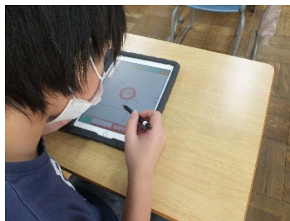
自分のペースで取り組める Qubena。 指導員からは進みが早いとの声も!

子どもたちも、お友達と一緒に勉強できる環境のもと、自分のペースで集中して、頑張っています。