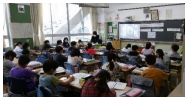
工場見学も教室から行いました

浜川小学校では、3年生社会科「工場見学」の授業を、ものづくりの工程を映した動画の「事前視聴」と Zoom を利用した「講師との質疑応答」という、ハイブリッド型（オフラインとオンラインの組み合わせ）の授業に挑戦しました。