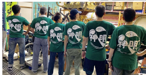
次回は、豊町四丁目町会にバトンタッチ