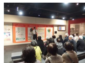
↑煙の中で移動する際の注意点を学ぶ

2月6日(木)、墨田区の本所防災館での施設見学会に14町会42名が参加しました。日本各地の自助・共助を意識した町会活動のVTRを視聴後、水圧のかかる扉を開けたり、煙の中を歩いたり、暴風雨の中で立ったりと実際に体験をしました。災害に備えた対策や発災時に注意すべき行動を考えるきっかけになりました。