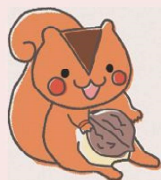
品川区 認知症啓発キャラクター くるみちゃん