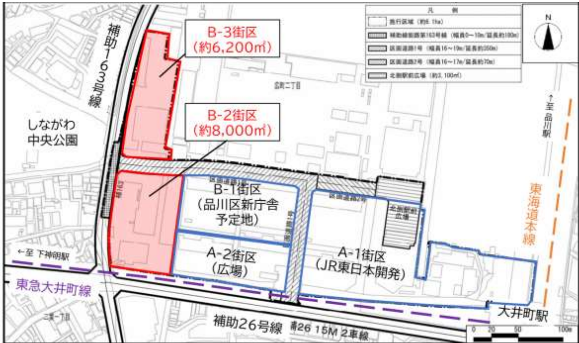
図-4. 広町地区案内図