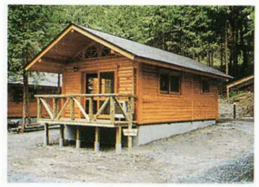
ヘルシー美里 (コテージ)

品川区総務課自治体連携担当 ☎03-5742-6856 早川町役場振興課振興・観光担当 ☎0556-45-2516