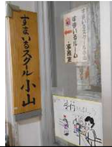
すまいるスクールの入口だよ