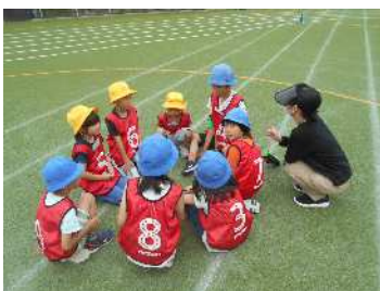
サッカーのポジション会議？