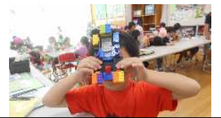
これは、どうでしょうか？