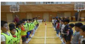
ドッジボール始まりま〜す 整列！