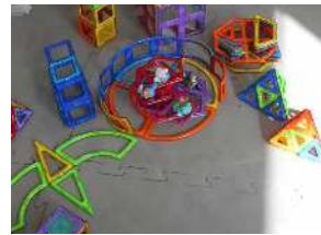
いろいろな形に作ってみたよ