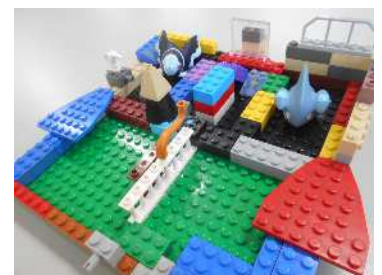
共同制作のブロック