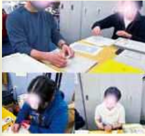
ラベル貼り・イラスト作成・切手仕分け