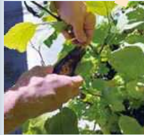
エール農園での野菜の収穫