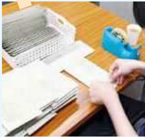
通信等の封入作業