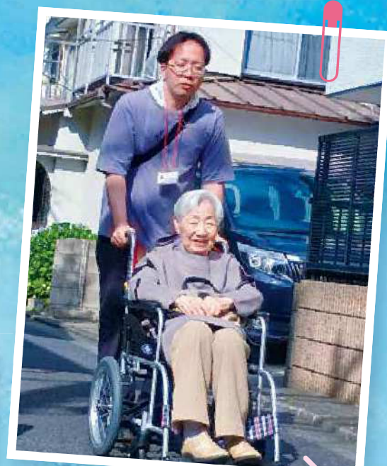
外出介助の活動中