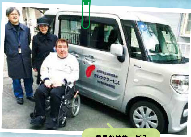
おでかけサービス