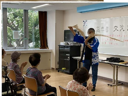
▶ 演芸(南京玉すだれ)