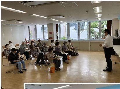
◀ 荏原警察署からの講話

次回開催は10月28日(金)の予定です。ご興味のある方は荏原第二地域センターにお問い合わせください。