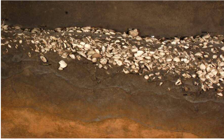
▲오모리 패총의 패총 표본(1984년 발굴)