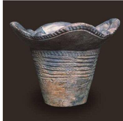
◀모스가 발굴한 토기 (도쿄 대학 종합연구박물관 소장)

모스(1838~1925)입니다. 모스는 중학교 졸업 후 제도공(製圖工) 일을 하면서 독학으로 조개를 연구하여, 대학의 학생 조수와 학예원, 대학 교수를 거쳐 1877년에 일본으로 건너와, 도쿄 대학의 초대 동물학 교수로 임명되었습니다. 같은 해 6월 19일, 요코하마에서 신바시로 향하는 기차 안에서 조개껍데기가 쌓여있는 모습을 발견한 모스는, 그것이 패총임을 간파했습니다. 두 차례의 예비조사 후, 발견으로부터 불과 4개월 후인 같은 해 10월 9일부터 본격적인 발굴조사를 시작했습니다.