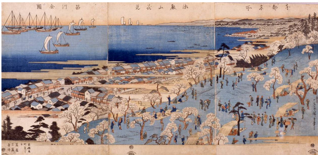
▲江戸名勝 御殿山賞櫻 歌川広重（初代）