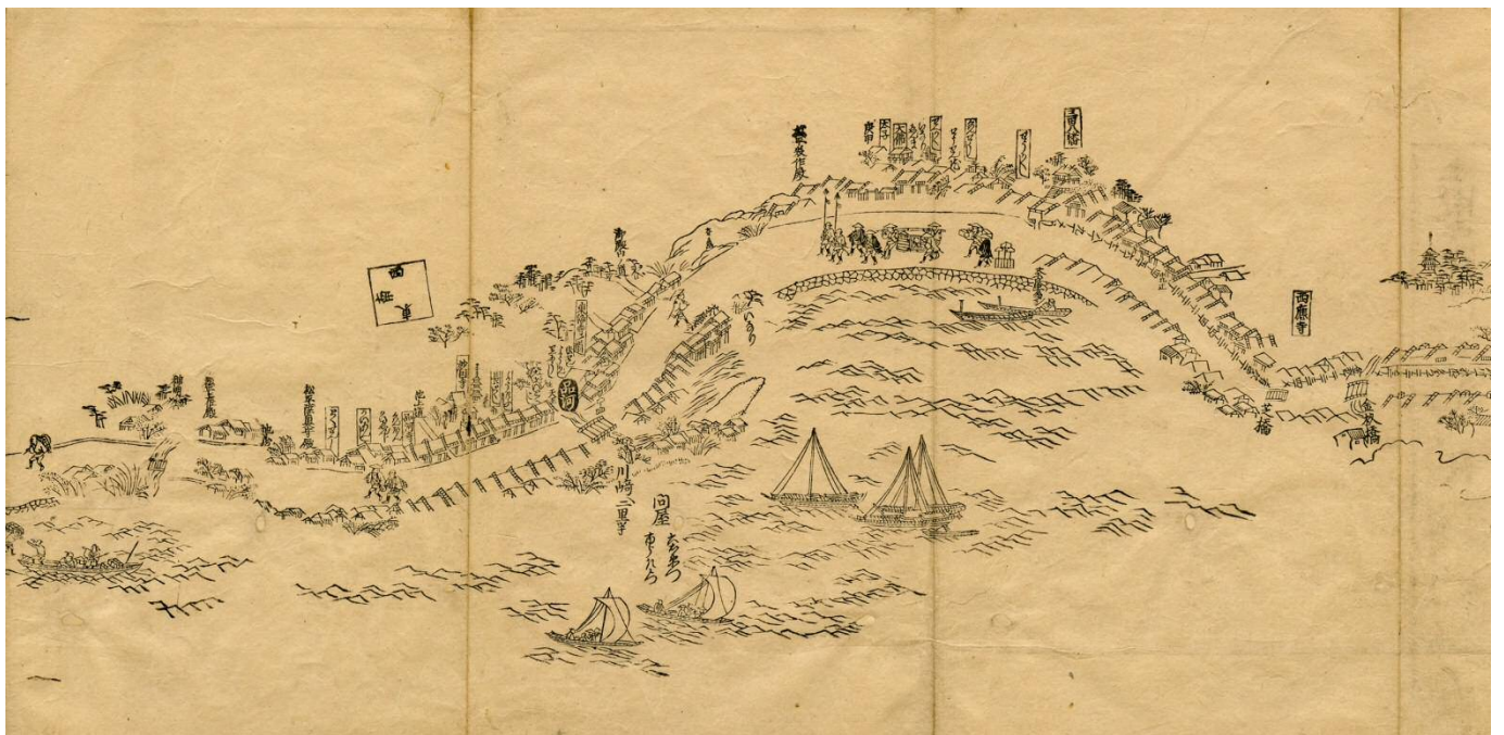
▲东海道绘图（品川部分） 远近道印作 菱川师宣绘

品川宿是东海道上从江户来数的第一处驿站，故经由东海道出入江户的人，一定会通过品川宿，来往人潮如涌，兴建了许多旅店和茶屋。其中甚至有以女性接待客人的旅店，1843年时共有92所。