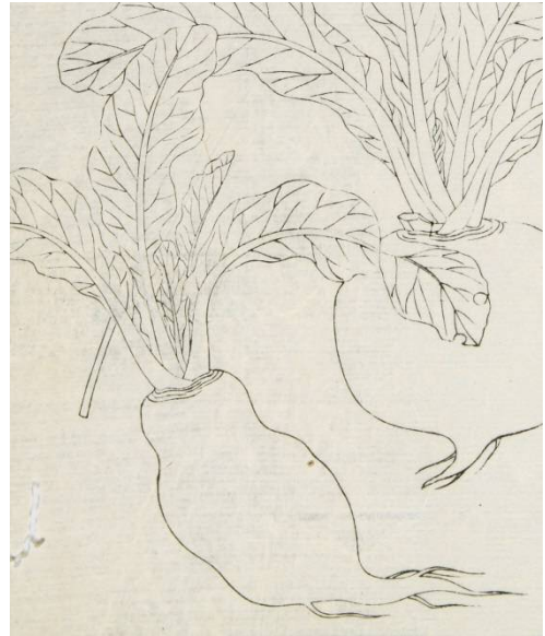
▲左边是品川芜菁

品川芜菁：1804年萨摩藩编纂的资料中，记载有向幕府进贡品川芜菁的纪录。此种芜菁的根较长，是腌制酱菜的便利食材。