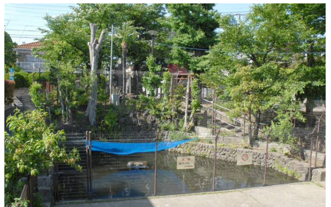
▲大井的原之水神池（品川区指定史迹）

品川仍保留着过去清洗蔬菜的场所，如大井水神、泷王子稻荷社内的水池、以及大井的原之水神池等处。大井的原之水神池旁设有纪念碑，标明此处曾经是清洗蔬菜的场所，让人不禁思念起那逝去的风景。