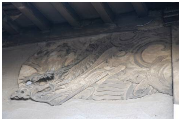
▲善福寺本堂(一部分)