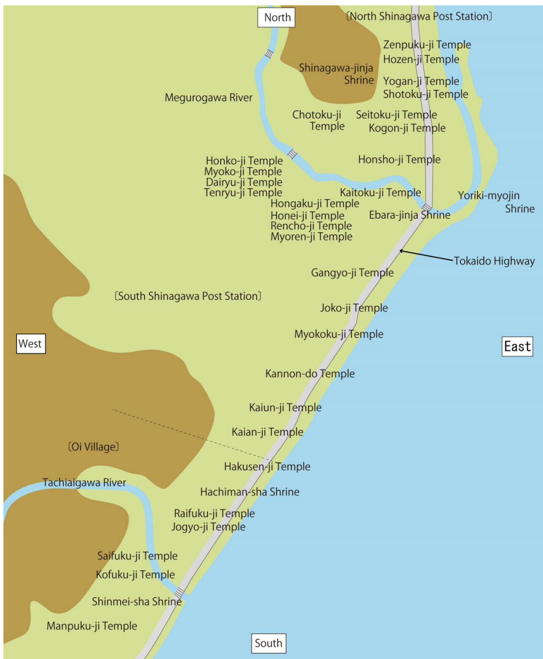
▲品川寺院神社推测图