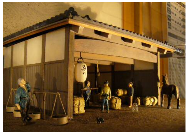
▲問屋場與貫目改所