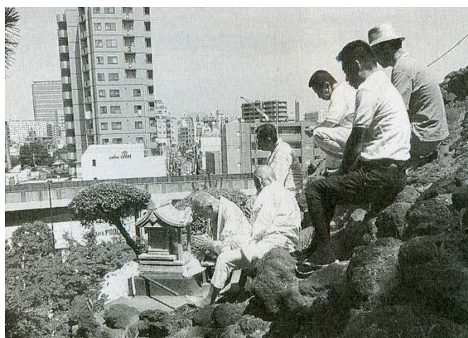
▲品川富士的開山儀式 (品川區指定無形民俗文化資產)

過去，品川宿共有6個富士山信仰團體，其中「丸嘉講」與「山清講」為自同一個團體分枝而出的團體。現在仍持續活動的僅剩「丸嘉講」，成員數雖逐漸下滑，但全盛時期曾超過300人。丸嘉講主要進行的活