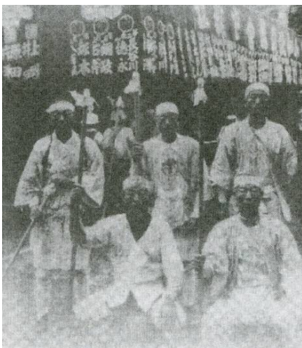
▲1930年代富士登山的模樣

當日於菊谷家住宿一宿，翌日凌晨4時穿著白衣裝，手持木杖出發。首先參拜富士吉田的北口本宮富士淺間神社，之後搭乘巴士前往海拔1420公尺的馬返，由此處進入吉田口登山道。行李交給菊谷家的2名搬運人，因此榎本手中僅拿著水壺和點心。