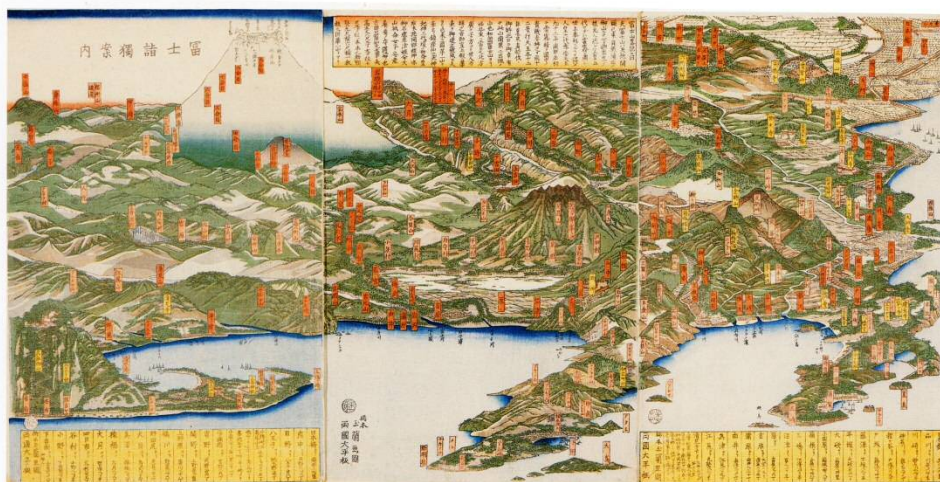
▲《富士山參拜指南》歌川貞秀（橋本玉蘭齋）作畫 1859年 品川歷史館館藏

根據日蓮宗僧侶「日親」於1470年留下的紀錄，品川的海運商人鈴木道胤每年6月會派遣6名官員至富士。當時，人們深信登上富士山能避免災難降臨，富士山因而成為人們朝聖參拜之聖地。