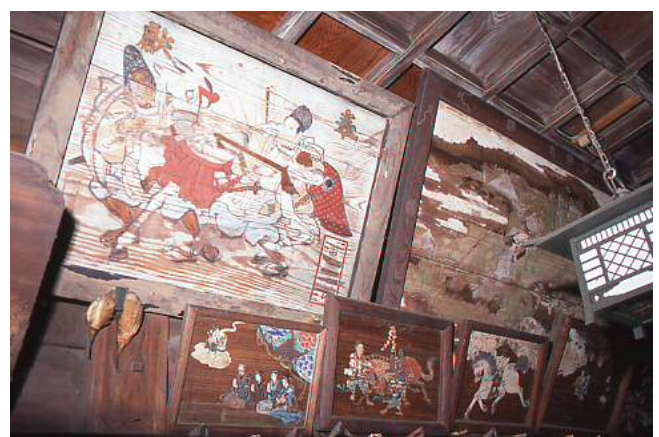
▲戶越八幡神社的繪馬

度受到重視。過去由供奉者自行繪製繪馬，現在則由神社寺院準備繪馬。每到新年，便可見到描繪著生肖、馬匹、寶船等各式各樣的繪馬，人們寫下行車平安、生意興隆、金榜題名等各種願望後供奉。繪馬的圖案變得統一，雖無法像以前由各式圖案展現出庶民生活的一面，但人們將願望託付於繪馬上的心意，至今不變。