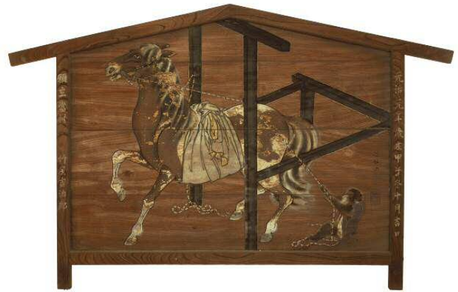
▲大繪馬（旗岡八幡神社藏品 品川區指定文化資產）