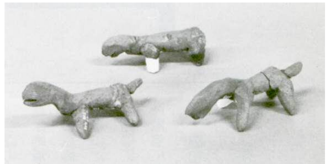
▲陶土馬俑（千葉縣印西市北之台遺址出土）（千葉縣立房總風土記之丘藏品）