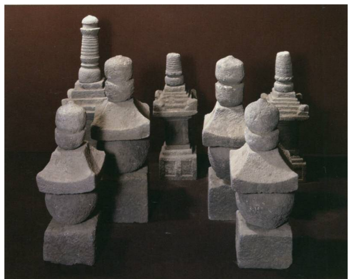
▲御殿山出土的寶篋印塔、五輪塔（法禪寺藏品）