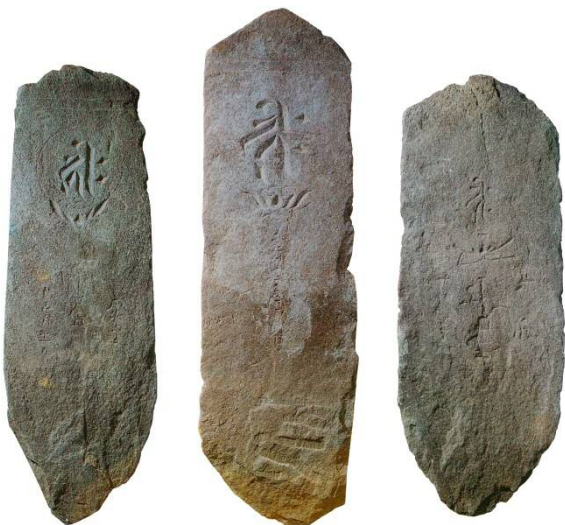
▲御殿山出土的石板碑（法禪寺藏品）

由此可知，品川的石塔混合了於其他地區常見的形狀，以及其他地區出產的材料。各式各樣不同的石塔，讓人想起過去品川沿岸寺院林立、作為交通要衝繁榮一時的時光。