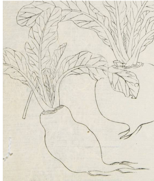
▲左為品川蕪菁

品川蕪菁：1804年由薩摩藩編纂的資料中，記載有向幕府進貢品川蕪菁的紀錄。此種蕪菁的根較長，非常適合用於醃製醬菜。