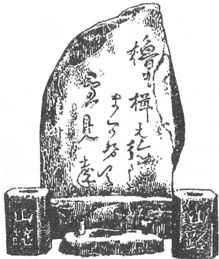
▲山路治郎兵衛勝孝之墓碑 (品川區指定史蹟)