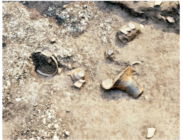
▲繩文陶器出土狀況