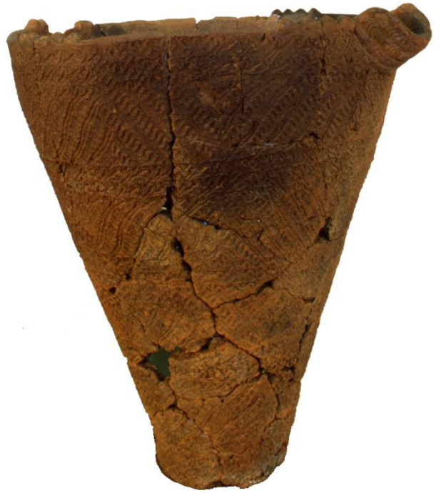
▲居木橋遺址出土的繩文陶器

貝殼中屬文蛤和血蚶最多。現在只有九州以南的溫暖海域可採集到血蚶，可見當時的氣候比現在溫暖許多。我們可以藉由諸如此類的觀察，由貝塚出土的貝殼、動植物種類，得知環境和地形的變化。