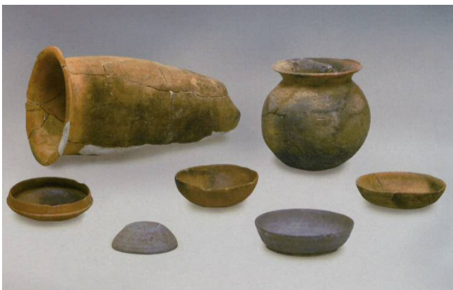
▲大井鹿島遺址出土的文物

須惠器比土師器堅固、持久性佳, 使用於壺、杯子等儲藏容器或餐具。須惠器持續使用至約 12 世紀, 之後的陶器也承襲了該技術。