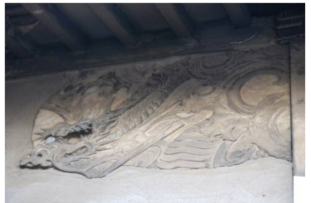
▲善福寺本堂(一部分)