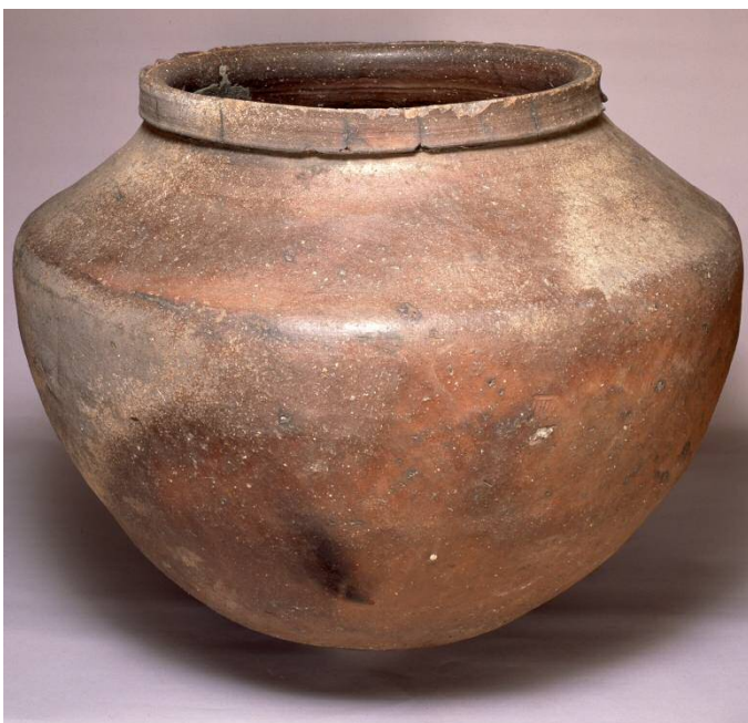
▲常滑大甕（品川歷史館館藏）

由前人的研究成果推測，此大甕為15世紀製作之物，有很多陶甕作為儲藏容器用於裝水的例子，但有的也用於存放佛經、遺體、遺骨、金錢等物。