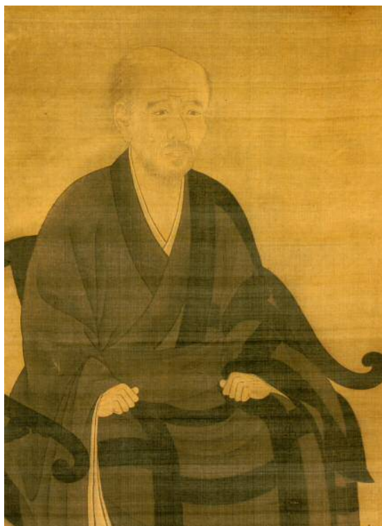
▲澤庵宗彭的肖像 東海寺藏品

1645年，澤庵留下「夢」一字後，即離開人世。東海寺的墓地中，安放著一塊天然大石，據傳該處即