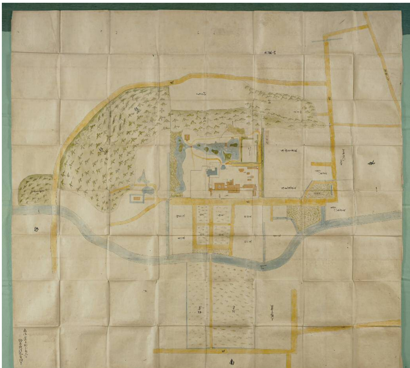
▲東海寺的繪圖(1660年,東海寺藏品)東海寺藏品中最为古老的繪圖