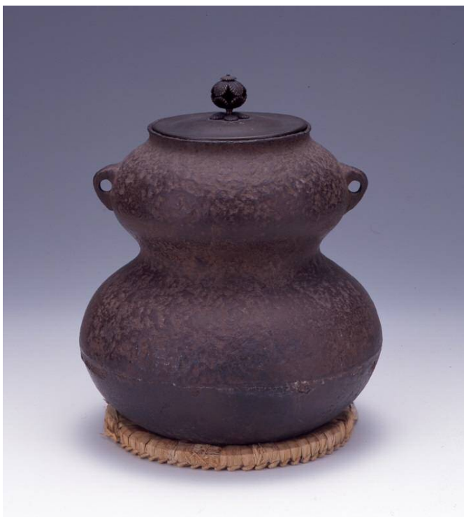
▲茶釜（燒水用的壺，下關豐功神社藏品）

品川御殿的所在地推測為現今東京都品川區北品川4丁目的旅館附近，根據1845年9月的史料記載，於約長寬14x11公尺範圍殘存有品川御殿基石。當時距品川御殿燒毀已經約過了150年，卻仍留存可一窺蹤跡的遺物。