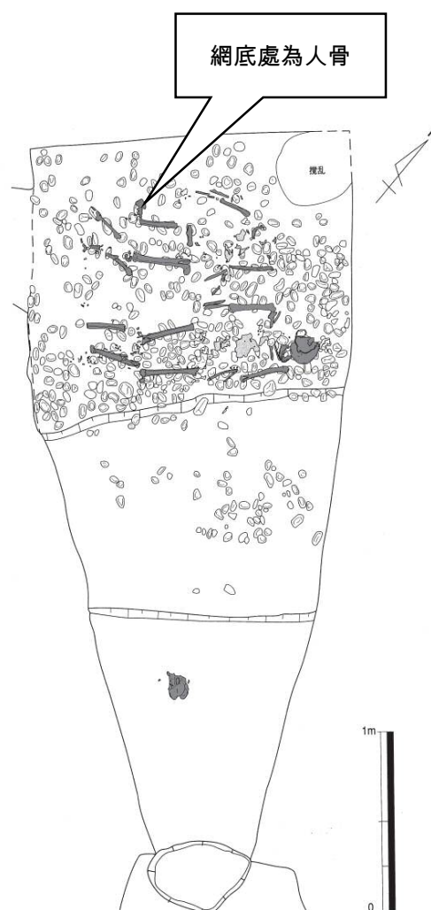
▲大井金子山横穴墓群第三號墓